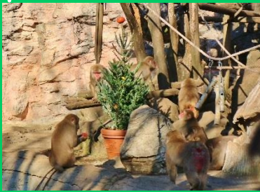
▲クリスマス特別ガイド (過去の様子)