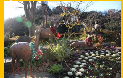
▲クリスマス装飾 (過去の様子)