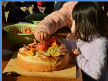
▲ツキノワグマの誕生日会 (過去の様子)