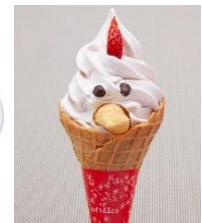
にわとりソフトクリーム