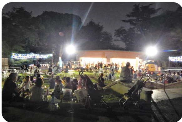
野毛山動物園 ひだまり広場ビアガーデンは大盛況!