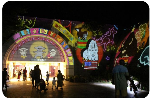
金沢動物園 プロジェクションマッピングは必見