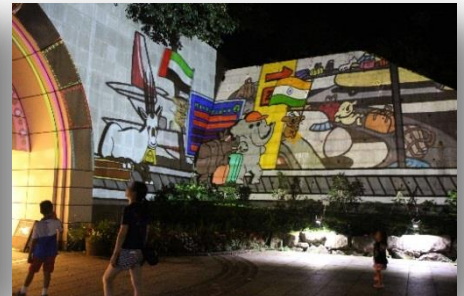
「おしゃべりナイト」