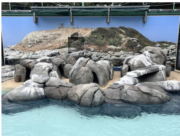
リニューアルした フンボルトペンギン展示場

なお、今回のフンボルトペンギン展示場のリニューアルは、野毛山動物園指定管理者である（公財）横浜市緑の協会が、横浜市による当園の一部リニューアル（「なかよし広場」（ふれあいコーナー）、屋内休憩棟、トイレ棟など）の時期にあわせて実施したものです。