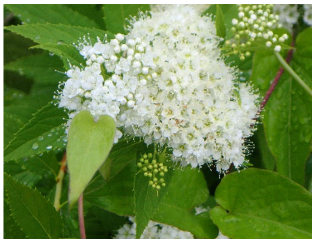
シロシモツケ (海の見える小径)