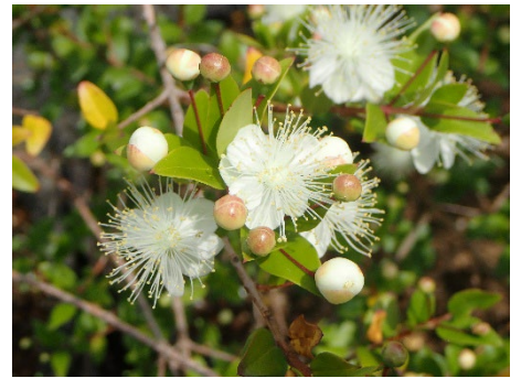
ギンバイカ (にこにこプラザ)