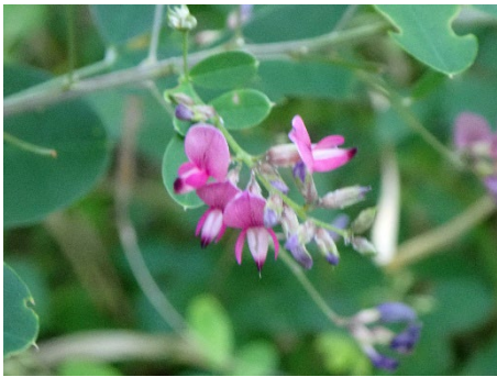
ミヤギノハギ (コアラバスルート)