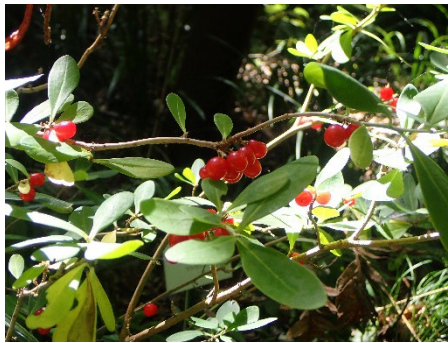
オニシバリ (しだの谷)