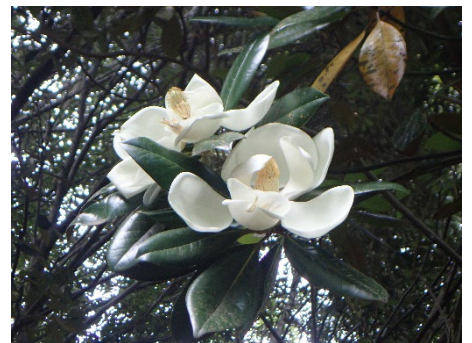
タイサンボク (なんだろ坂)