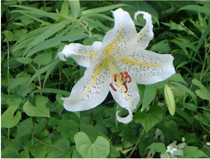
ヤマユリ (アフリカ区)