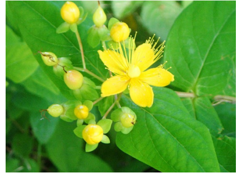
ヒペリカム (ののはな館前)