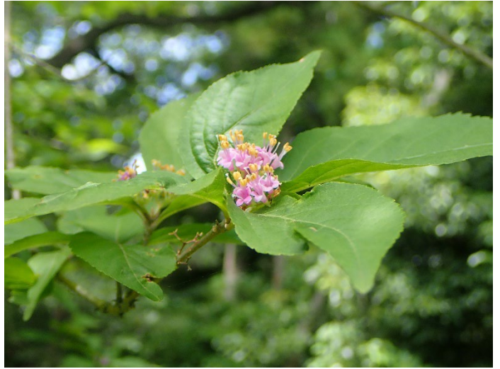
ムラサキシキブ (おもしろ自然林他)