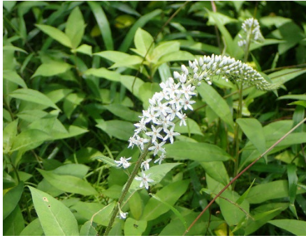
オカトラノオ (おもしろ自然林)