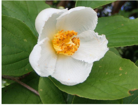
ナツツバキ (しだの谷)