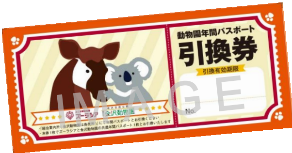
動物園年間パスポート引換券

ご家族や大切な方へのプレゼント、忘年会の景品、読者プレゼントなどの様々なシーンでご利用いただけます! コメントが書けるチケット用封筒もご用意しております!