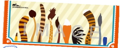
チケット用封筒 (裏)