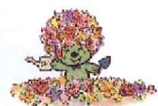
マスコットキャラクター 「ガーデンベア」

【問合せ】ガーデンネックレス横浜 NTT ハローダイヤル 050-5548-8686 (9～20時) ※ご案内期間は6月10日まで