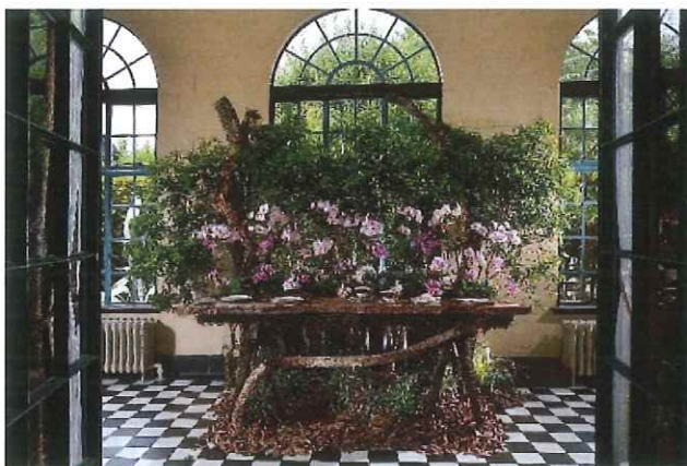
花と器のハーモニー2019の様子

横浜山手西洋館では、令和 6 年 6 月 1 日(土)～9 日(日)の 9 日間、「花と器のハーモニー 2024」を開催します