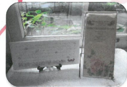
一筆箋 (縦書・横書)

8 cm×20 cm 各 450 円 (税込) 西洋館とバラのクラシカルなデザイン 思い出のひとつにどうぞ