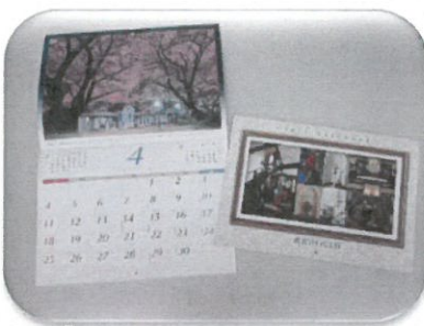
2021 西洋館カレンダー

1,100 円 (税込) 15 cm×21 cm (マチなし) ファスナー付きで通帳入れにも good! 西洋館 8 館の刺繍入り