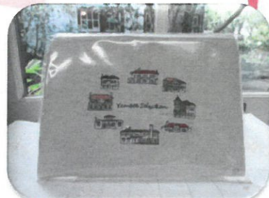
新商品 リネン刺繍ポーチ

85 g 入り 330 円 (税込) バラの花びら入りのローズドロップ 新デザインで登場!