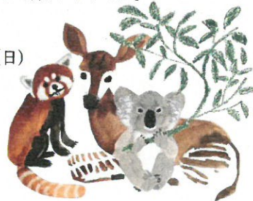
イラスト: サクマユウコ氏