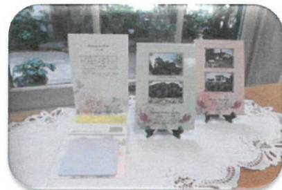
ふせん (3種) 各 490 円 (税込)

8 cm×20 cm 各 450 円 (税込) 西洋館とバラのクラシカルなデザイン 思い出のひとつにどうぞ