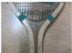
丸善の LAUREL CROWN のエンブレム

イギリスで始まったばかりのローンテニスが横浜に上陸し、1876年（明治9年）には居留地外国人が山手公園でプレーしていました。そして、ローンテニスは日本人の間にも広まり、海外で活躍する日本人選手も現れてきました。1920年（大正9年）のアントワープ第7回オリンピックで、熊谷一弥選手はシングルスで銀メダル、柏尾誠一郎選手と組んだダブルスでも銀メダルを獲得しました。日本人選手初のメダルでした。