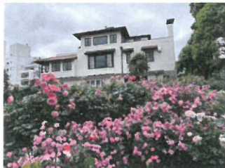
ローズガーデンからの山手111番館