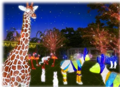
ズーラシア ※イメージ図