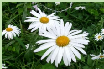
▲シャスターデージー