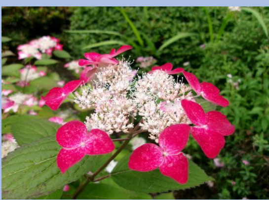
▲ヤマアジサイ クレナイ