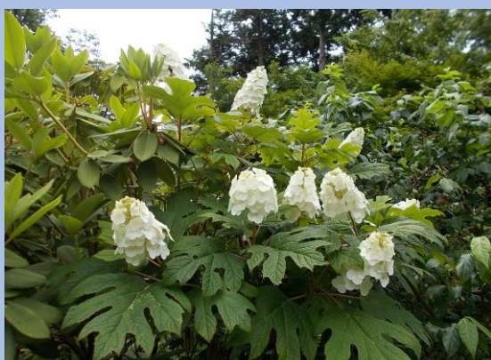
▲カシワバアジサイ