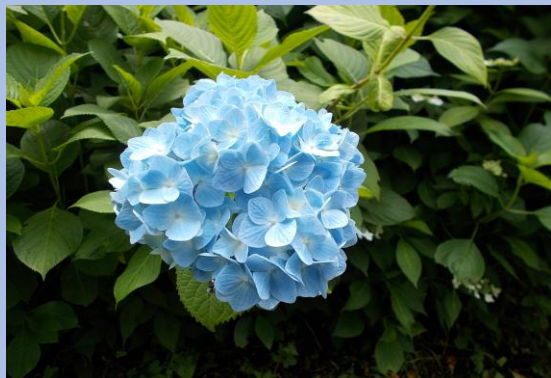
▲セイヨウアジサイ 青花

俣野別邸庭園では、あじさい園他に約150株の各種アジサイが植栽されています。 河岸段丘の傾斜地に植栽されているため、立体的にアジサイを楽しむことができます。