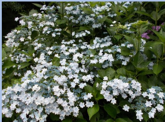
▲ガクアジサイ 墨田の花火