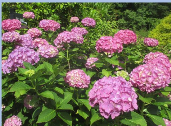
▲セイヨウアジサイ 赤花