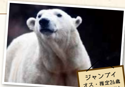
ジャンプイ オス・推定26歳 (好きな食べ物) 脂ののったサバ