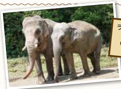
ラスクマル(左) オス・29歳 (好きな食べ物) サツマイモ