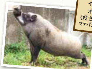
イノッチ オス・6歳 (好きな食べ物) マテバシのドングリ