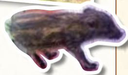
ウリ坊の頃のイノッチ