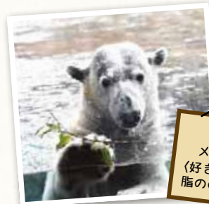
ツヨシ メス・15歳 (好きな食べ物) 脂ののったサバ

開園当時から人気の看板ホッキョクグマ「ジャンプイ」は、冬には体重400kgにもなります。大好物のサバを目かけ、大きな水しぶきをあげてプールへダイビングする姿は迫力満点です。