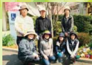
◀活動メンバー ▼四季の花々に彩られた花壇

四季折々季節の花々に彩られた花壇は、花の名前を表示したり、剪定した草花やハーブをケアプラザにお届けしたりと様々な活動をとおして、施設の利用者や地域の皆様からも大変喜ばれています。