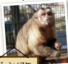
ジュンノスケ オス・11歳 (好きな食べ物) バナナ

「ボス」として、群れのみんから信頼される頼もしいジュンノスケ。筋肉質で立派な体格とこわそうな見かけをしていますが、群れの子どもの遊び相手もしてくれる優しい性格です。ひときわ体の大きいジュンノスケを見つけてください。