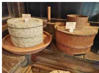
石臼 (いしうす) 自家用の小麦粉やきな粉を製粉する