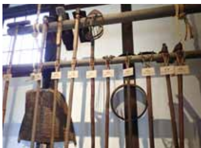
鍬 (くわ) 食物を掘り起こす様々な形の鍬