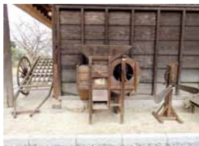
唐箕 (とうみ) 風力によって粉や玄米をより分ける