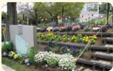
グランノア港北の丘みどりの会