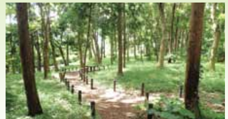
維持管理を実施した樹林地(泉の森ふれあい樹林)