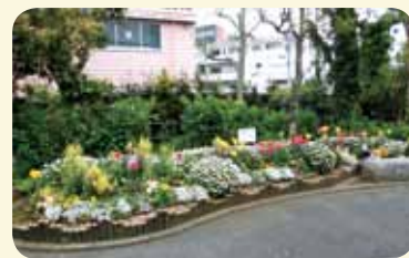
鶴ヶ峰バス停花壇を作る会

よこはま緑の推進団体に対して、年2回（春と秋）の花苗等を助成するほか、園芸資材の購入支援、研修会やイベント情報の提供など様々な緑化活動のサポートを行っています。