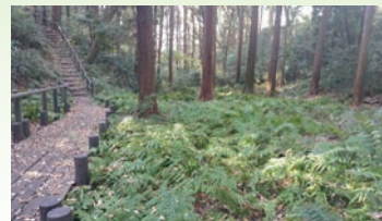
森づくりガイドライン等を活用した維持管理の推進(戸塚区/ウイトリッヒの森)

※数値は、端数処理を行っています。また、( )内は平成30年度の実績を示しています。