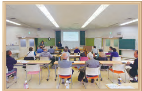
よこはま花と緑の推進リーダー育成講座

「よこはま緑の推進団体」の活動を活性化させるため、花苗や園芸資材等の購入支援、緑化に関する情報発信のほか、研修会の開催や活動費の助成等を行っています。