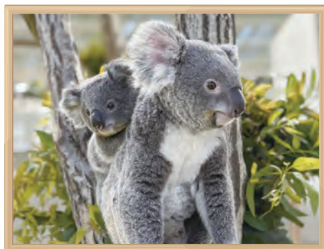
金沢動物園 コアラ

飼育展示動物の新規収集や補充のため、他園と動物交換や貸借を行っています。また、動物の誕生・死亡・移動等の情報を記録する動物台帳の管理、国内外の関係団体と協力した血統管理を行っています。