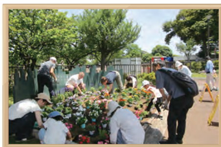
岸根公園 花壇づくり