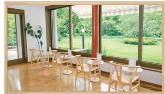
俣野別邸庭園 ひだまりガーデン