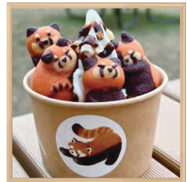
野毛山動物園 レッサーパンダDXサンデー