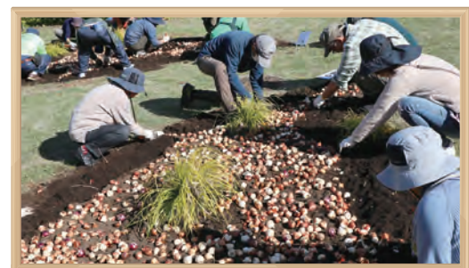
「花壇づくりの世界記録に挑戦」イベント

開催地出展の事業主体である「GREEN×EXPO 2027 横浜市出展市民活動フィールド実行委員会」の委員として参画し、「花壇づくりの世界記録に挑戦」や「テーマガーデンの運営」に取り組んでいます。また、公園、動物園では、「GREEN×EXPO 2027応援花壇」の設置・管理を行うほか、よこはま動物園ズーラシアでは、「オフィシャルストア」を展開するなど、様々な連携・協力の取組を行っています。