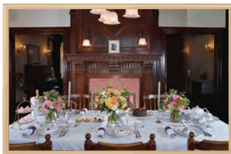
横浜山手西洋館 花と器のハーモニー

歴史文化施設等を活用した展示やコンサート、講習会等を実施することで、文化・芸術の振興を図るとともに、観光客誘致など、賑わいの創出に取り組んでいます。