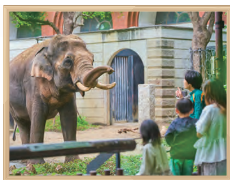
よこはま動物園ズーラシア 飼育員のとっておきタイム

動物園でのボランティア活動をはじめ、市民・来園者の皆様が管理運営に携われる取組を進めています。