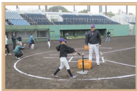
俣野公園 野球教室

園内の運動施設を活用して、野球教室やテニス教室等のスポーツに関する催物を開催しています。また、各種スポーツ大会を実施し、スポーツの振興を図っています。