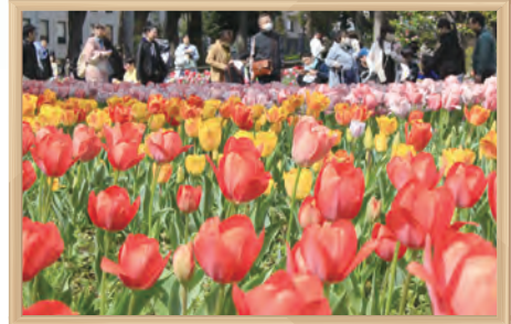
よこはま花と緑の春フェア

また、市民の皆様が積極的に緑化推進に参加できる研修会を実施するほか、各区で開催される区民まつりに参加して基金のPRや募金活動を行う等、普及啓発に取り組んでいます。