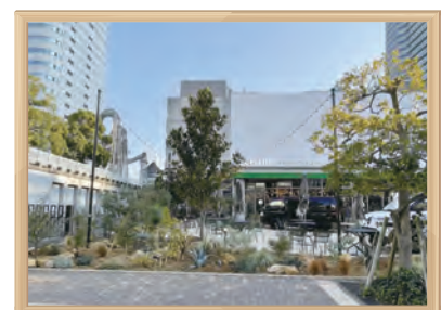
公開性のある緑空間の創出

次世代を担う子どもたちが緑と親しみ、感性豊かに成長できるよう、民間の保育園、幼稚園、小中学校を対象に、施設のニーズに合わせた多様な緑の創出・育成を進めています。また、指導者、子どもたち向けに花や緑に親しむきっかけづくりの体験講座等を行っています。