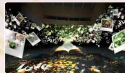
テーマ館屋内展示イメージ