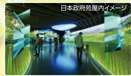
日本政府苑屋内イメージ

また屋内展示では、全国各地で継承されてきた自然と人との営み・共生の姿や、植物・自然と人の関わりが生み出した文化の極みであるいけばな、盆栽等を鑑賞するとともに、みどりをもたらす未来の姿を提示し、社会課題の解決や行動変容の糸口を世界に発信します。