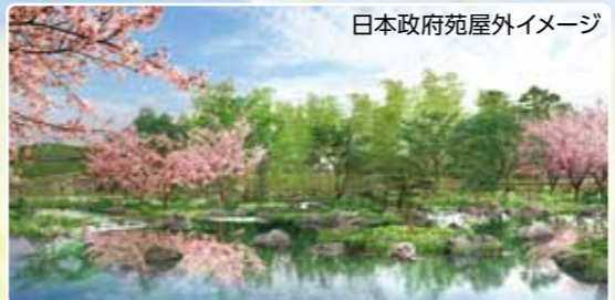
日本政府苑屋外イメージ

コンセプトは「日本の自然観を再考し、未来へ進む」で、規模は会場内で最大となる2.5haに及びます。