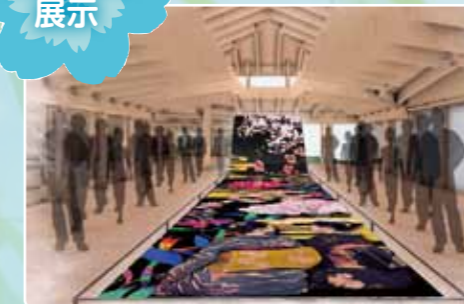
園芸文化展示イメージ

日本の園芸文化は江戸期に世界最高水準に発達しました。日本人が自然を親しみ現代に受け継いできた、数々の伝統園芸植物を季節ごとに入れ替えて展示します。園芸文化展示では、江戸時代に発展した世界に誇る園芸文化やその真髓をお伝えします。また、建物の外では、江戸の植木屋・花屋敷を再現し、江戸時代にタイムスリップしたかのように日本の園芸文化の水準の高さや自然観、季節感を体感いただけます。