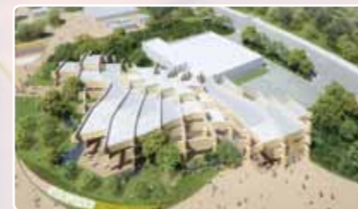
テーマ館外観イメージ

地球上のすべての生命のうち、重量で82%を占める植物。テーマ館では、地球を支える命の根源である植物の真の姿を、最新の映像技術と研究成果をアートエンターテインメントの掛け算により紹介します。また、東日本大震災の津波に耐えた陸前高田市の「奇跡の一本松」を震災復興の象徴として展示活用し、植物が菌類と共生する土の中の世界を表現します。