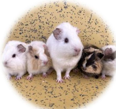
モルモット 野毛山動物園