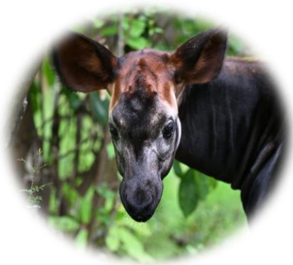
オカピ よこはま動物園ズーラシア