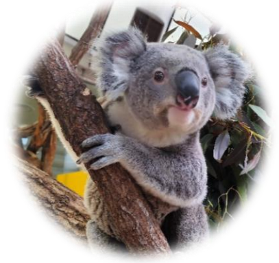
コアラ 金沢動物園