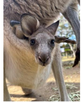
【オオカンガルーの赤ちゃん】