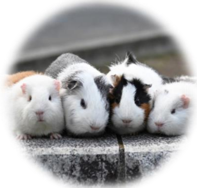
モルモット 野毛山動物園