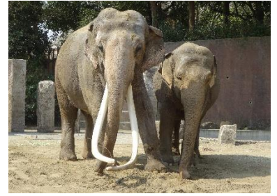
【インドゾウのボンとヨーコ】