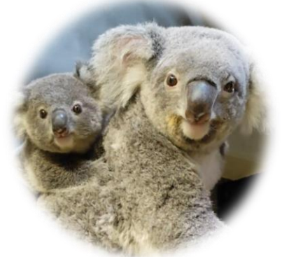
コアラ 金沢動物園