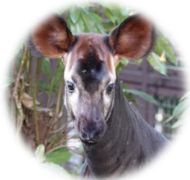
オカピ よこはま動物園ズーラシア