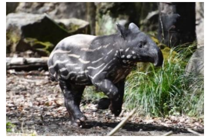
【マレーバクの赤ちゃん】