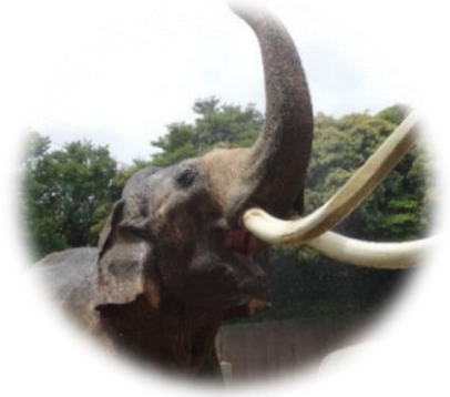
【インドゾウ】 金沢動物園