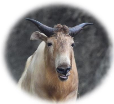
【ゴールデンターキン】 よこはま動物園ズーラシア