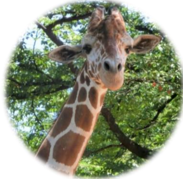
【キリン】 野毛山動物園