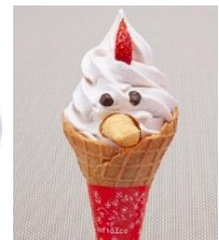
にわとりソフトクリーム