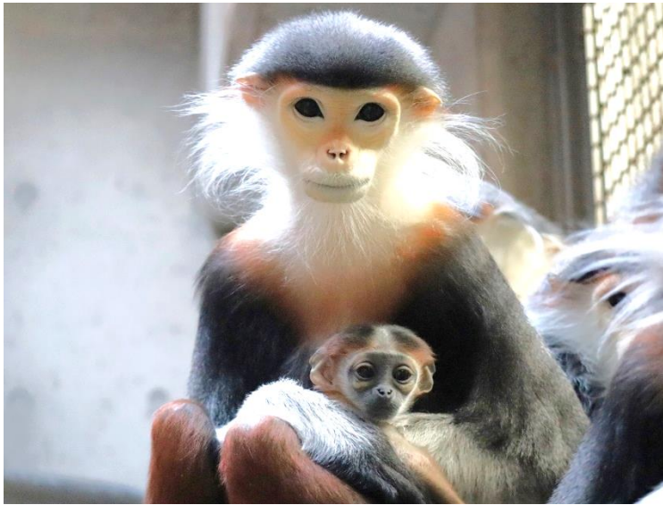
母親のワニと赤ちゃん (1月26日撮影)

赤ちゃんの公開は3月以降を予定しています。愛称投票の実施方法等につきましては、決まりましたらホームページ等でお知らせします。