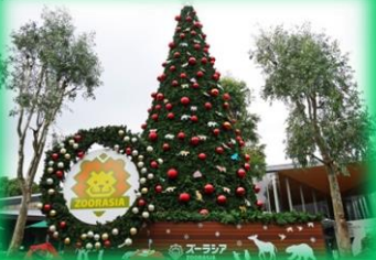
▲ハッピークリスマス in ズーラシア (昨年の様子)