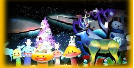
▲ひかるかなざわクリスマス (昨年の様子)