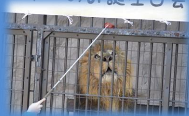
▲ラジャーお誕生日会 (昨年の様子)