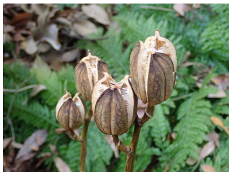
ウバユリ (シダの谷)