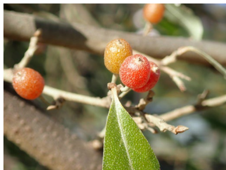
アキグミ (なんだろ坂)