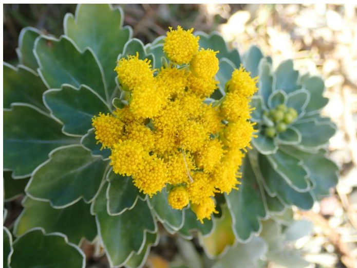
イソギク (オセアニア区)