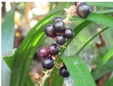
ヤブラン (シダの谷)