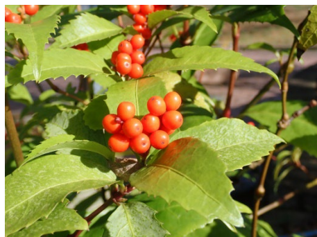
センリョウ (ののはな館前)