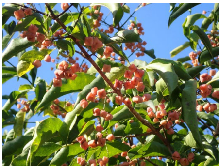
マユミ (海の見える小径)