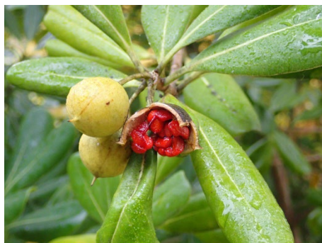
トベラ (バーベキュー広場)