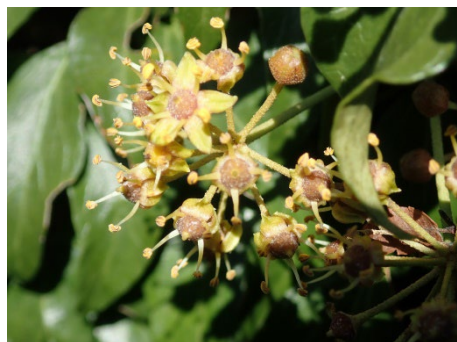
キツタ (ののはなカフェ前)