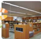
ののはな館 図書スペース