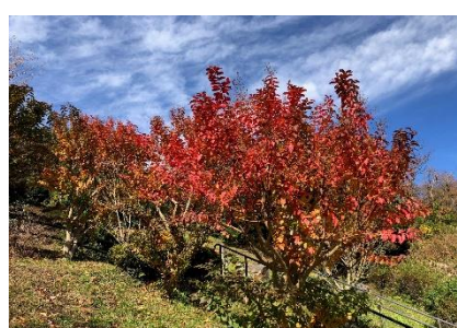
金沢自然公園 こども広場