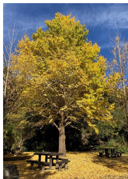
金沢自然公園 バーベキュー広場