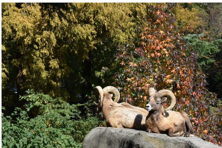
オオツノヒツジと紅葉