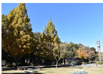
金沢動物園 わくわく広場