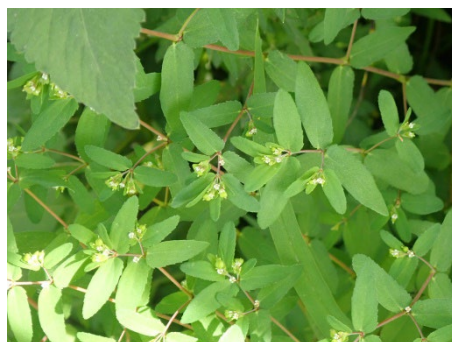
オオニシキソウ (高速道路側道)