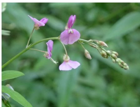
アレチヌスビトハギ (しだの谷)