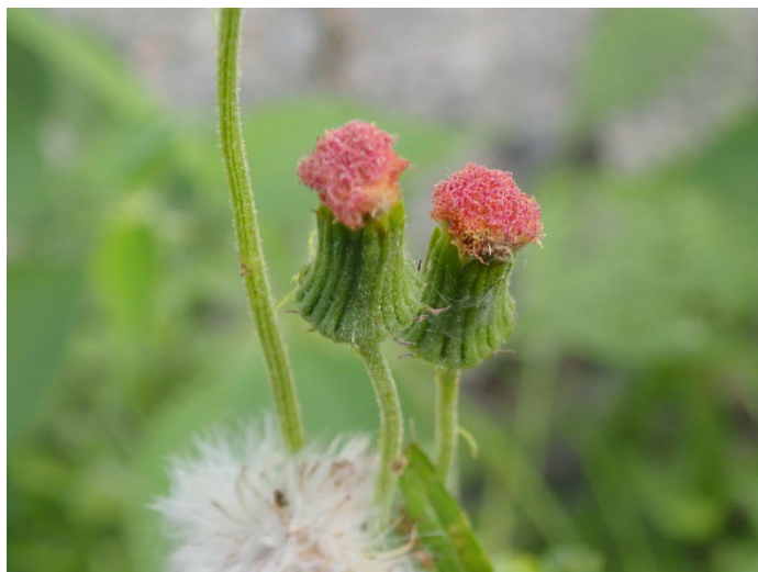
ベニバナボロギク (高速道路側道)