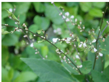
ヌスビトハギ (しだの谷)