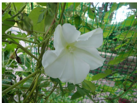
ユウガオ (ののほな館前)