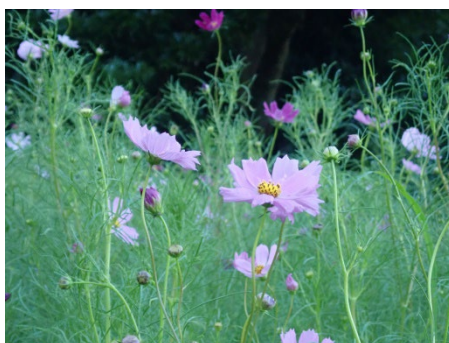
コスモス (こども広場)