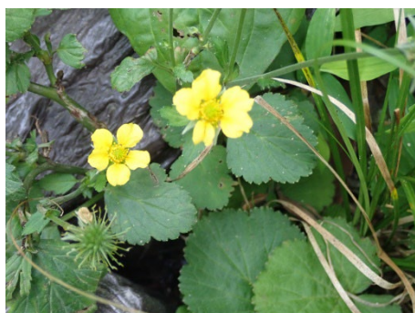
ダイコンソウ (しだの谷)