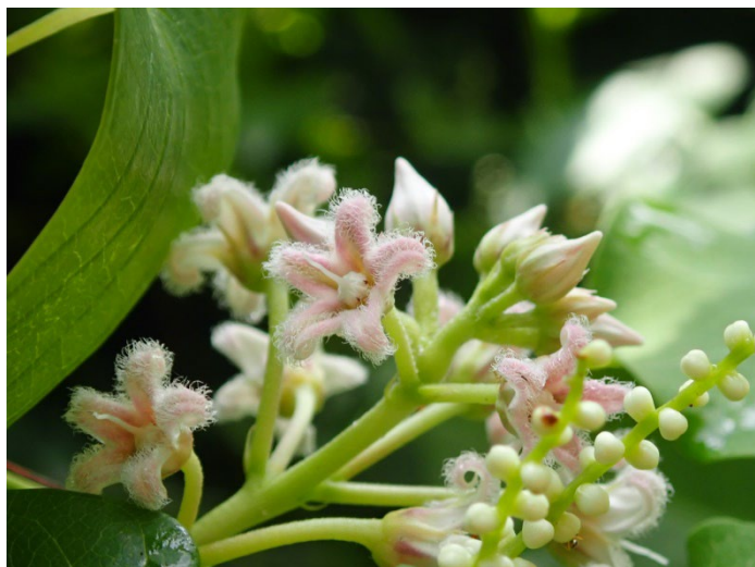
ガガイモ (しだの谷)