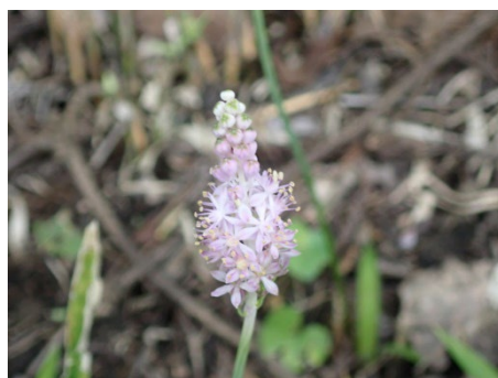
ツルボ (高速道路側道)