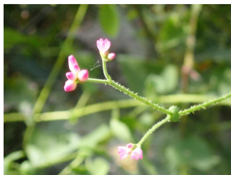
ママコノシリヌグイ (高速道路側道)