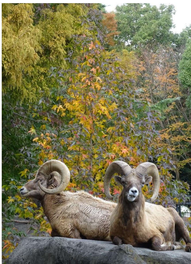
オオツノヒツジとモミジバフウ