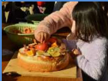
▲ツキノワグマの誕生日会 (過去の様子)