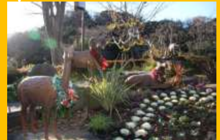
▲クリスマス装飾 (過去の様子)