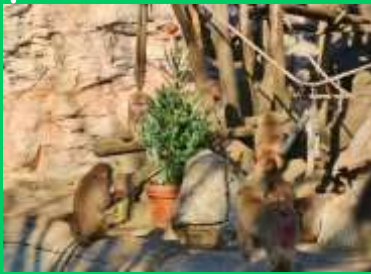
▲クリスマス特別ガイド (過去の様子)