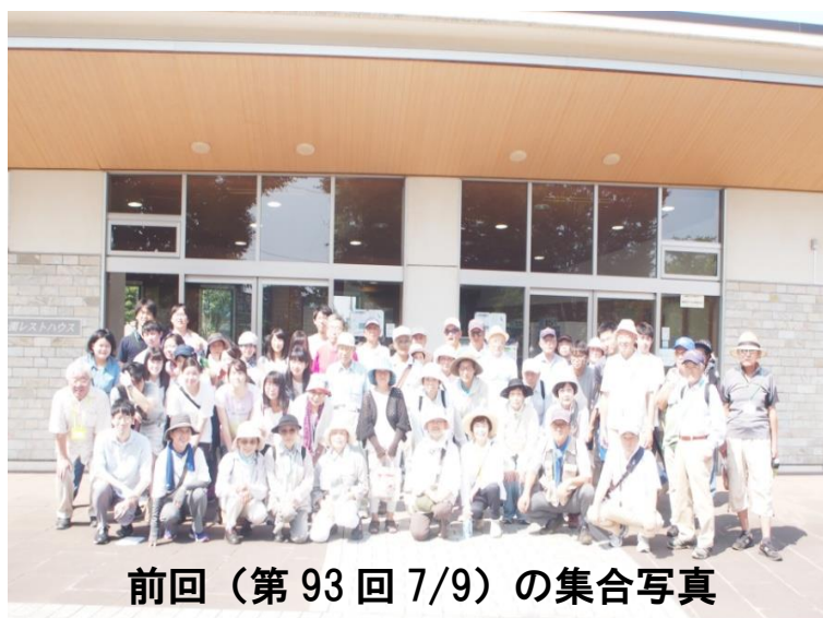
前回（第 93 回 7/9）の集合写真