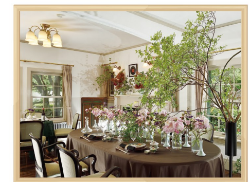
横浜山手西洋館 花と器のハーモニー

歴史文化施設等を活用した展示、コンサートや講習会等を実施し、文化・芸術の振興を図るとともに、観光客誘致など賑わいの創出に取り組んでいます。