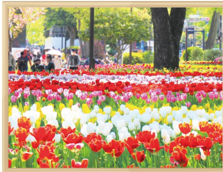
よこはま花と緑の春フェア

国際園芸博覧会に向け、「よこはま緑の推進団体」「よこはま花と緑の推進リーダー」の中から、花と緑に関する専門知識を持った人材を、「ガーデンネックレス横浜ボランティアガイド」として育成しています。また、市民協働による新たな花壇づくりや維持管理作業について、同団体・リーダーなどと連携を図っています。