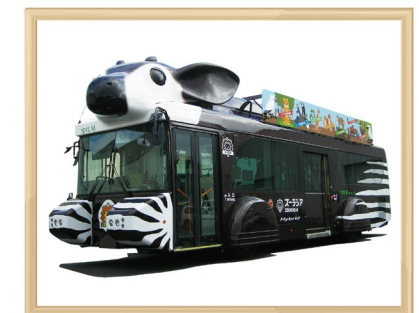
オカビ型バス「ズッピ」