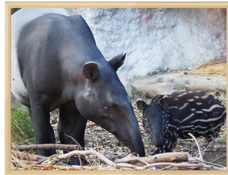
よこはま動物園 マレーバクの親子

血液検査・レントゲン検査・超音波検査機器等による健康管理のための動物検診、ワクチン接種等による感染症予防、新規搬入動物の検疫、死亡動物の病理解剖等の獣医療を行っています。