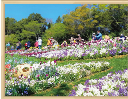
里山ガーデンフェスタ

横浜市で展開する「ガーデンネックレス横浜」の一環として、「里山ガーデンフェスタ」(ガーデンネックレス横浜実行委員会運営)と「よこはま花と緑の春フェア」(よこはま花と緑の春フェア運営委員会運営)を開催し、花や緑による賑わいを創出することで、緑化への関心を高めています。また、各種イベントで「よこはま緑の街づくり基金」のPRや募金活動を行うなど、緑化の普及啓発に取り組んでいます。