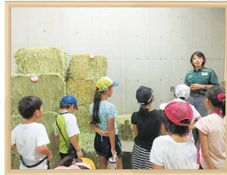
よこはま動物園 バックヤードツアー