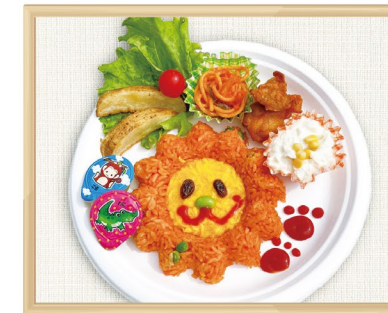
野毛山動物園 ラージャーランチ

公園(根岸森林公園、俣野別邸庭園等)、横浜山手西洋館(外交官の家、山手111番館等)、動物園で飲食施設を運営しています。