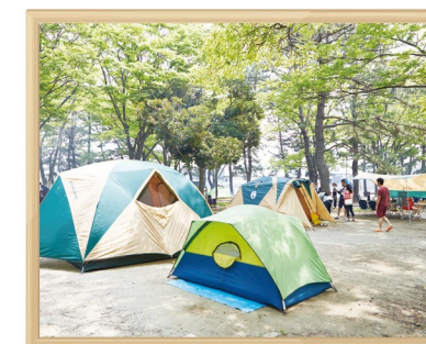
野島公園キャンプ場

こども自然公園、金沢自然公園、海の公園、野島公園でバーベキュー場を運営しています。野島公園は、キャンプ場を併設しています。