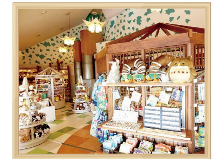
金沢動物園 ののはなギフトショップ