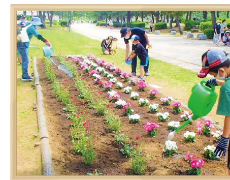
海の公園 花壇作り