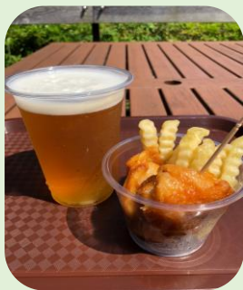
「わくわくポテカラセット」

たこ焼き、焼きそば、フライドポテト(3つのフレーバー)などの定番メニューを販売します。 新メニューの「スペシャルかき氷」は、かき氷とソフトクリームの上にフルーツをトッピングした夏 季限定のおすすめ商品です。そのほか「わくわくポテカラセット」などのお得なセットメニューも新 登場です。