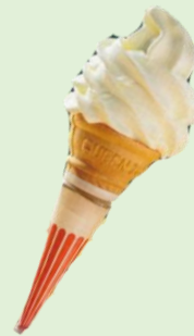
地元小野ファームの牛乳を使用した ソフトクリーム