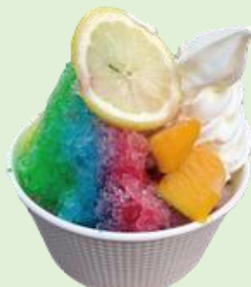
「スペシャルかき氷」