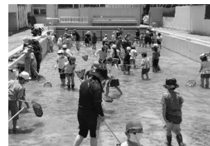
長浜公園 ヤゴ救出大作戦