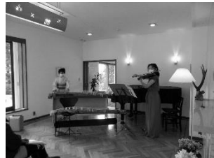
俣野別邸庭園 リビングコンサート