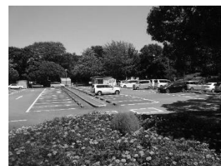
こども自然公園駐車場

令和3年度は、7月から10月にかけて発令された緊急事態宣言や、1月から3月にかけて発令されたまん延防止等重点措置などの中でも、手指の消毒資材設置や換気の徹底、マスクの使用励行など感染防止対策を徹底することで営業を継続し、公益目的事業等の財源とするための収益確保に尽力しました。また、各飲食施設や物販施設等において、キャッシュレス決済システムを適宜導入し、お客様サービスの向上を図りました。