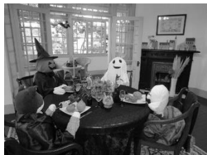
山手西洋館 ハロウィンウォーク