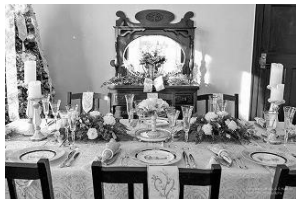
横浜山手西洋館 世界のクリスマス