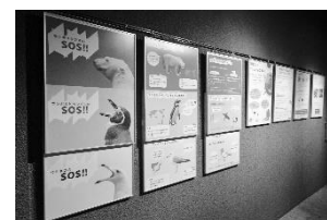
よこはま動物園 海のいきものSOS展

よこはま動物園では、「干支展」等、動物の魅力や生態を伝える企画展を開催したほか、「海のいきものSOS展」や「村田園長のとおき写真展」から派生したワークショップやトークショーを実施しました。