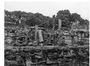
よこはま動物園 ニホンザル展示場止まり木