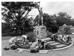
三ツ沢公園 花苗植え付け