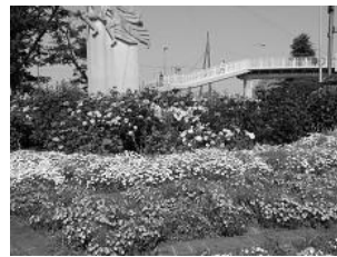
三ツ沢公園 国際園芸博覧会ロータリー花壇