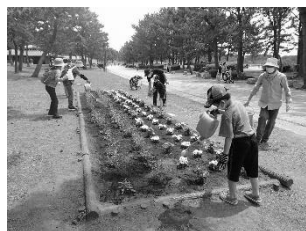
海の公園 ボランティア DAY