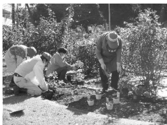
国際園芸博覧会応援花壇 三ツ沢公園

花壇の設置・管理を通じて、推進団体、推進リーダー及び市民ボランティアの皆様は、国際園芸博覧会を盛り上げるための機運が醸成されたほか、花壇に国際園芸博覧会の案内看板を設置することで、市民の皆様の認知向上につなげました。