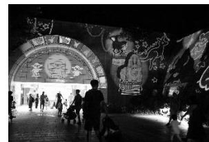
金沢動物園 プロジェクションマッピング