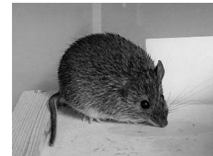
金沢動物園 アマミトゲネズミ

アマミトゲネズミの雄 3 頭、雌 3 頭を導入し飼育下繁殖に取り組み、3 月に繁殖に成功しました。