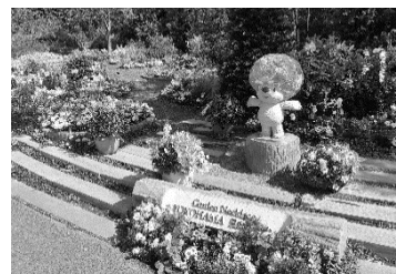
里山ガーデンフェスタ

令和 3 年度は、春の里山ガーデンフェスタを令和 3 年 3 月 27 日から 5 月 9 日まで開催しました。今回は、「実りの春(みのりのはる)」をテーマに春の華やかな色彩の花畑に実りの果樹を配置し、ビタミンカラーで躍動感を表現しました。これらの取組により、過去最高となる 171,128 人の皆様にご来場いただきました。