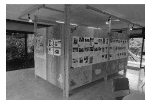
金沢動物園 写真で紡ぐ、思い出の中の動物園