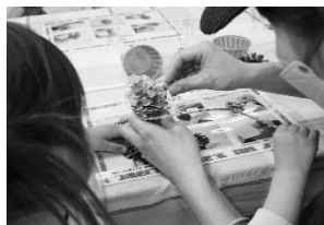
よこはま動物園 ハッピークリスマス