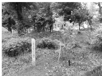
記念植樹事業助成

市民・企業・団体等の皆様へ緑化活動支援や人材育成を行うとともに、緑化に関する広報を行いました。