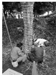
ナラ枯れ対策の様子

(注) ナラ枯れとは、カシノナガキイムシが媒介するナラ菌により、ブナ科樹木が枯れる現象のこと。