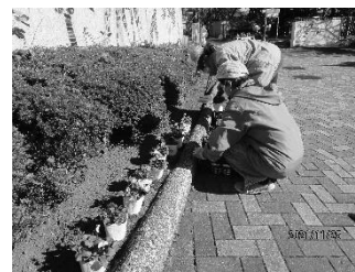
国際園芸博覧会応援花壇 金沢自然公園