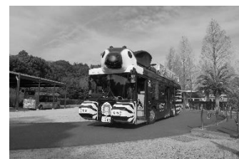
よこはま動物園 ズッピ

よこはま動物園内において来園者の利便性を向上させるため、オカピ型バス「ズッピ」号と「サバンナ」号の2台の運行を行いました。