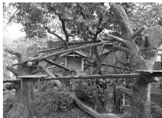
野毛山動物園 レッサーパンダ展示場改修