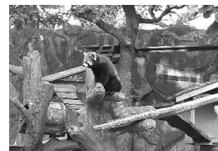
野毛山動物園 レッサーパンダ展示場改修

当協会初の取組として、野毛山動物園の開園 70 周年に合わせ、4 月から 6 月にかけて、レッサーパンダ展示場改修の原資とするためのクラウドファンディングを実施しました。目標額 1,000,000 円に対し、総額 5,707,500 円のご支援をいただきました。展示場改修は 11 月に完成し、来園者・市民の皆様に公開しました。