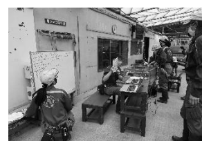
野毛山動物園 オンライン環境教育