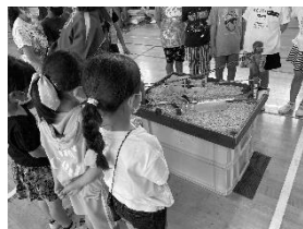
野毛山動物園 出張観察名人