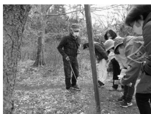
俣野別邸庭園 庭園散歩