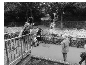
金沢動物園 キリンガイド