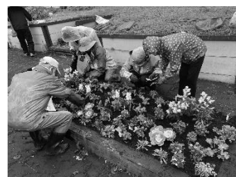
推進リーダー育成講座