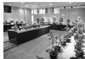
こども植物園 さつき盆栽展