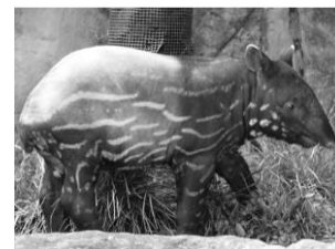
よこはま動物園 1月に繁殖したマレーバク

動物園の4つの役割である「種の保存」、「調査研究」、「環境教育」、「レクリエーション」を着実に果たすために、来園者・市民の皆様に対して野生生物や自然環境の保全の重要性を啓発しました。また、絶滅の危機に瀕している野生生物の繁殖や行動などの研究を行いました。加えて、施設を安全・安心・快適にご利用いただくための管理運営を行いました。