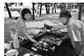
野島公園バーベキュー場

緊急事態宣言期間中は、横浜市の指示により新規予約受付停止や酒類提供停止を行いました。