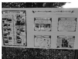
野毛山動物園 レッサーパンダパネル展