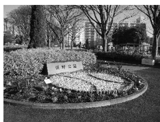
国際園芸博覧会応援花壇 俣野公園