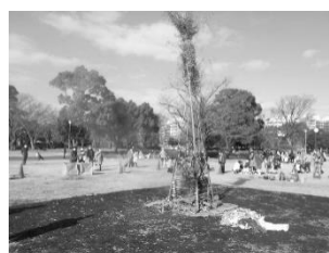
俣野公園 プレイパーク