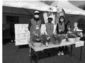
ガーデンネックレス横浜 ガイドボランティア