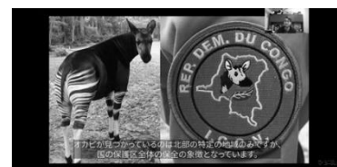
よこはま動物園 オカピオンラインシンポジウム

よこはま動物園では、7月の「海の日」に合わせ、海洋プラスチック問題についての講演会「海の生き物SOSトーク～かもめの暮らす海を考える～」を実施したほか、1月には、アメリカに本拠地を置く「オカピ保全プロジェクト」のメンバーに、オカピの野生の状況や保存活動についてお話いただく初のオンラインシンポジウム「よこはまのどうぶつえん×オカピ保全プロジェクト～オカピの森が世界をつなぐ！～」を実施しました。