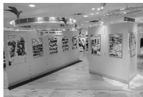
野毛山動物園 横浜高島屋パネル展