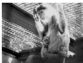
よこはま動物園 アカアシドウクラングール