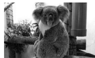
金沢動物園 コアラ