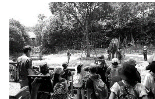
よこはま動物園 「動物園のお仕事」