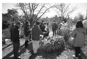
よこはま花と緑の推進リーダー育成講座