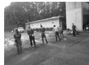
よこはま動物園 消火訓練の様子

利用者のニーズを把握するためのアンケート調査の実施や、近隣の警察や消防署等と連携して災害や事故に対する訓練を行ったほか、7 月には、よこはま動物園にキャッシュレス購入ができる券売機を導入し、利用者サービスの向上や安全・安心な施設利用の促進に努めました。