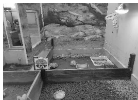
野毛山動物園 あちこち 70