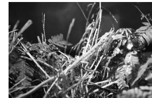
野毛山動物園 ミヤコカナヘビ

令和 3 年度は、新規導入された 10 頭の飼育を通じて、飼育下繁殖技術の向上と科学的知見の集積に取り組みました。