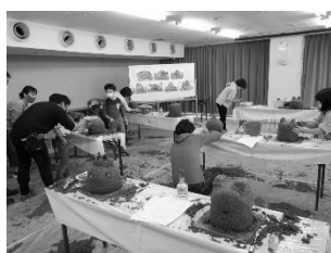
海の公園 海の環境を考える親子講座