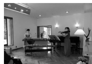
俣野別邸庭園 リビングコンサート