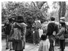
よこはま動物園 ガイドツアー