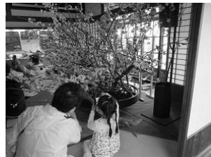
野島公園 花と博文邸