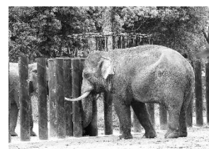
よこはま動物園 インドゾウ自動給餌器

金沢動物園では、パルマワラビー展示場への床面ゴムチップ施工、インドゾウ舎などで使用する耕運機等購入に活用しました。