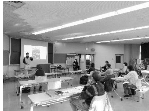
ガーデンネックレス横浜 ガイドボランティア育成講座