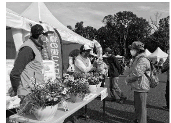
ガーデンネックレス横浜 ガイドボランティア

推進リーダーの中から受講生を募集し、ガーデンネックレス横浜ガイドボランティア育成講座を実施しました。講座を修了した8名が、3月26日(土)から毎週土・日曜日に里山ガーデンフェスタでの活動を開始しました。