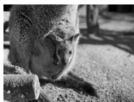
野毛山動物園 オグロワラビー