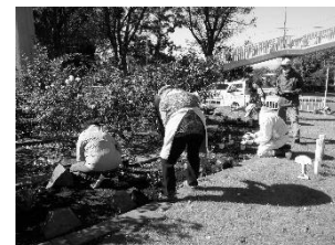
市民協働花壇づくり （国際園芸博覧会応援花壇）

令和9年に横浜市で開催予定の国際園芸博覧会に向け、推進団体や、推進リーダーの中から、花と緑に関する専門知識を持った人材を育成するとともに、市民協働による新たな花壇づくりや、維持管理作業について「推進リーダー」「推進団体」などと連携を図りました。