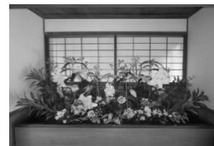
野島公園 季節の装飾

公園緑地や植物園等の特性を活かした体験活動やイベント、文化・芸術やスポーツ振興に寄与する事業を実施し、利用者の皆様へ様々な活動の機会を提供するとともに、地域社会のコミュニティ形成の促進を図りました。また、「快適できれいな公園づくり」を目指し、管理する11公園・施設で安全・安心・快適な公園の管理運営に努めました。