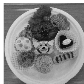
野毛山動物園ひだまりカフェ レッサーパンダランチ

また、各動物園では、地元の食材にこだわったカレーやうどんなど、地産地消を取り入れたメニュー開発に努めました。特に、野毛山動物園では、レッサーパンダ展示場のリニューアルに合わせ、オリジナルメニュー「レッサーパンダランチ」を販売しました。また、金沢動物園では、開園40周年記念メニュー「ボンくんのランチプレート」の販売を開始しました。