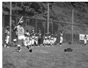
長浜公園 トスベースボール大会