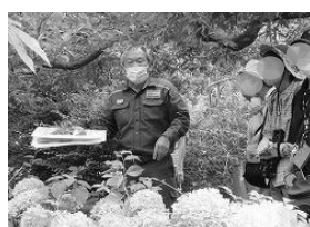
子ども植物園ガイドツアー