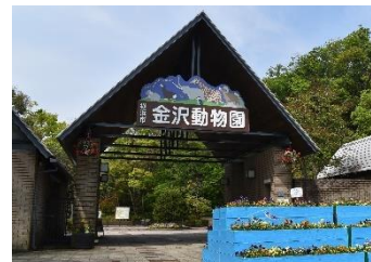
金沢動物園 看板更新