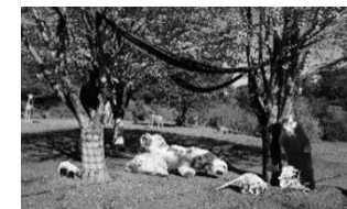
よこはま動物園 ズーラシアフェス