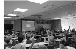
よこはま動物園 オンラインプログラム