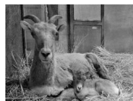
金沢動物園 オオツノヒツジ