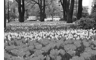
横浜公園のチューリップ

令和3年度はこれらの活動について、令和2年度から続くコロナの感染拡大防止対策により、中止や縮小などの影響がありました。