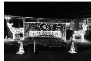
よこはま動物園 ナイトズーラシア