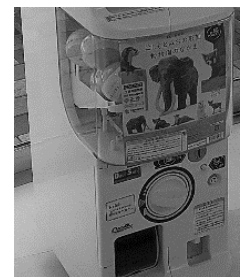
カプセルトイのフィギュア

各動物園では、3動物園で飼育する動物をモチーフにした「はしもとみおの彫刻 動物園のなかま」(カプセルトイのフィギュア)を販売し、ヒット商品となりました。また、よこはま動物園では、飼育員が監修し、動物の特徴を再現したぬいぐるみ(ヒガシクロサイ、セスジキノボリカンガルーなど)を販売しました。