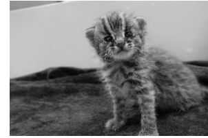
よこはま動物園 出園したツシマヤマネコ

また、11 月から 12 月にかけて雌 2 頭、雄 2 頭を新たに導入し、12 月から 1 月にかけて左記 4 頭に対し人工授精を実施しました。そのほか、飼育展示を通じて市民の皆様への普及活動を行いました。