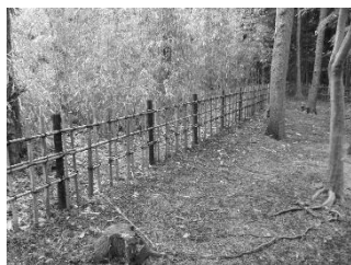
よこはま動物園 四ツ目垣更新