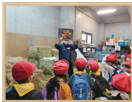
よこはま動物園 学習プログラム