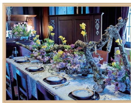
横浜山手西洋館 山手芸術祭

歴史文化施設等を活用した展示、コンサートや講習会等を実施することで、文化・芸術の振興を図るとともに、観光客誘致など賑わいの創出に取り組んでいます。