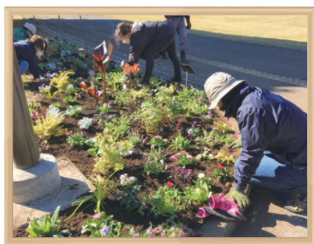
根岸森林公園 国際園芸博覧会応援花壇づくり