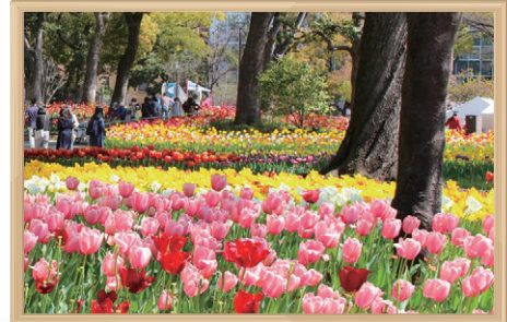
よこはま花と緑の春フェア

「GREEN × EXPO 2027」での活躍を視野に入れ、「よこはま緑の推進団体」「よこはま花と緑の推進リーダー」の中から、花と緑に関する専門知識を持った人材を、「ガーデンネックレス横浜ガイドボランティア」として育成しています。また、市民協働による新たな花壇づくりや維持管理作業について、同団体・リーダーなどと連携を図っています。