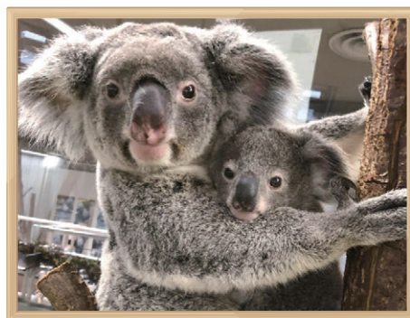
金沢動物園 コアラの親子

飼育展示動物の新規収集や補充のため、他園と動物交換や貸借を行っています。また、動物の誕生・死亡・移動等の情報を記録する動物台帳の管理を行うとともに、国内外の関係団体と協力して血統管理を行っています。