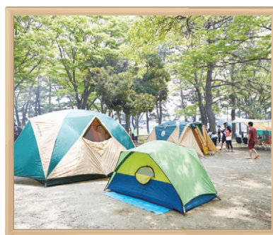
野島公園キャンプ場