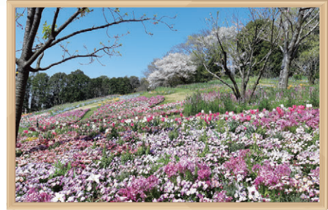
里山ガーデンフェスタ

また、各種イベントで「よこはま緑の街づくり基金」のPRや募金活動を行うなど、緑化の普及啓発に取り組んでいます。