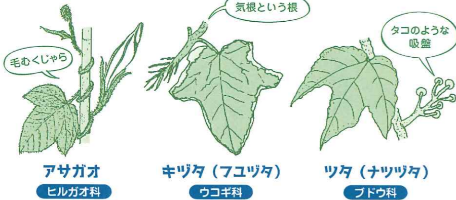
アサガオ ヒルガオ科

まきひげの他にも、毛のはえたつるでまきついたり、根や吸盤でくっついたり、いろいろな工夫をしています。アサガオの葉や茎は、毛が下向きに生えていて、滑らないようにくふうしています。キツタは気根という根で、ツタはタコのような吸盤ではりついて、あっという間に、壁をおおってしまうほど成長します。