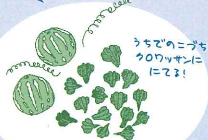
オキナワスメウリ