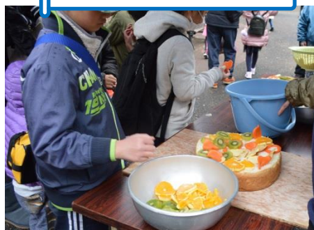
▲ツキノワグマの誕生日会