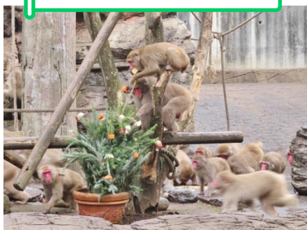
▲クリスマス特別ガイド