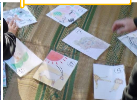
▲金沢動物園でお正月